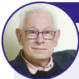
PHILIPPE MEIRIEU professeur des universités en sciences de l'éducation